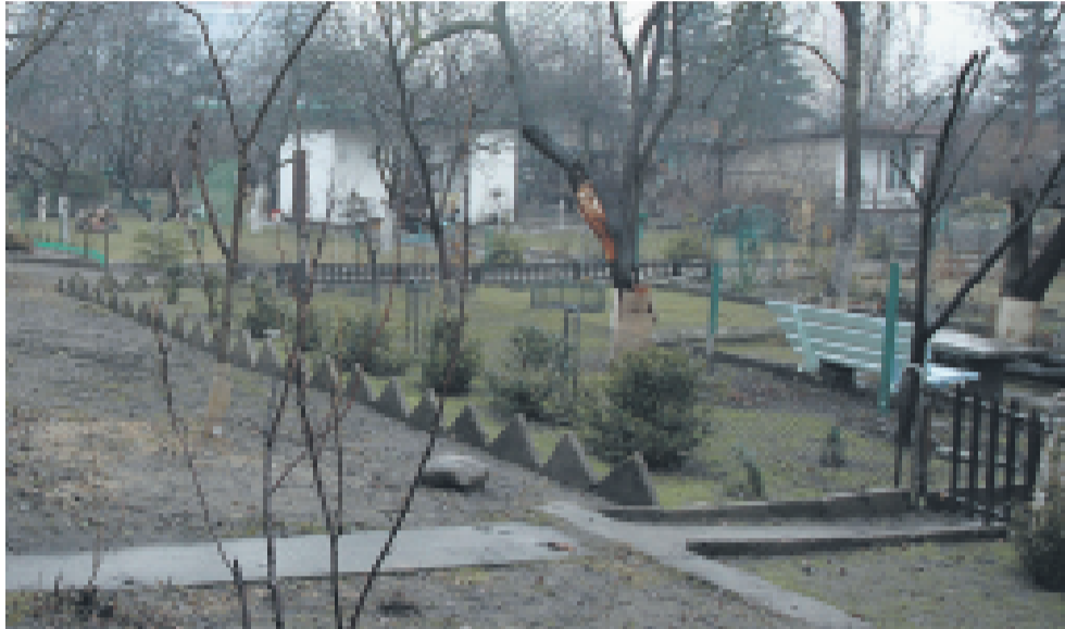
W tym roku inspektorzy PINB skontrolują około 100 obiektów na poznańskich działkach

W 2008 roku musiał się rozpocząć przegląd ogrodów. Szafy w PINB nie pomieściłyby kolejnych donosów. A tych tylko