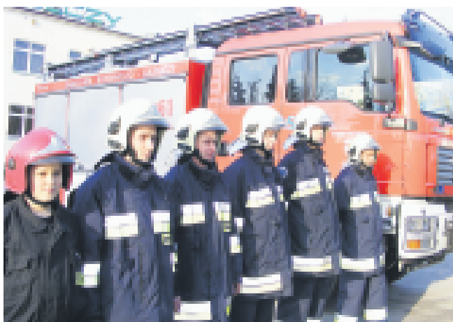
Mosińscy strażacy odebrali nowy samochód

– Otrzymaliśmy wezwanie do jednego z mosińskich zakładów pracy. Na miejscu zastaliśmy mężczyznę z obficie krwawiącą raną. Ponieważ mieliśmy na wyposażeniu odpowiedni preparat, udało mi się zatamować krwawienie i dzięki temu ocalić życie temu człowiekowi – mówi mosiński strażak.